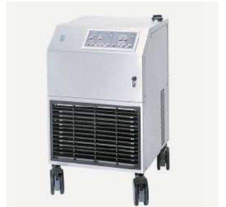
Die Heater-Cooler-Unit, die die Zürcher Infektiologen untersucht haben.

Schleimschicht. In solch einem Biofilm sitzen auch die Mykobakterien, die dort vor Antibiotika oder Chemikalien geschützt sind. Das erschwert die Behandlung von Patienten, deren Herzklappen- oder auch Aortenprothesen von Mykobakterien befallen sind. In der Regel erhalten sie vier verschiedene Antibiotika gleichzeitig. Doch in vielen Fällen dringen diese Medikamente kaum in die Biofilme ein. Dann bleibt nichts anderes übrig, als die Prothesen auszuwechseln. Oft hilft das alles nichts: «Die Sterberate liegt bisher bei rund 50 Prozent», sagt Sax. (fs)